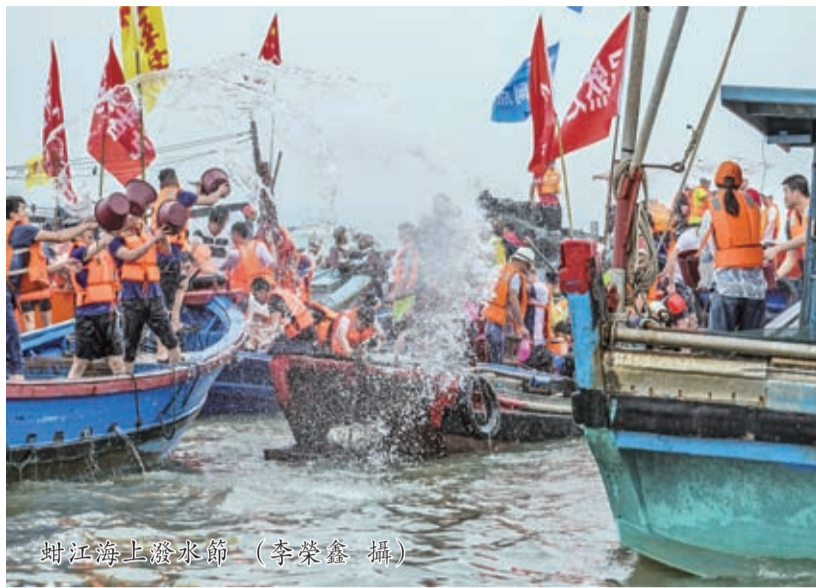
蚶江海上潑水節

今年距離清政府批令蚶江與鹿港正式通航，在蚶江設海防官署，為清朝的“泉州總口”已有240周年。再過兩個月，第十八屆“閩臺對渡文化節暨蚶江海上潑水節”也將來臨，我又來到蚶江後澳古渡口，任思緒再一次穿越歷史烟雲。